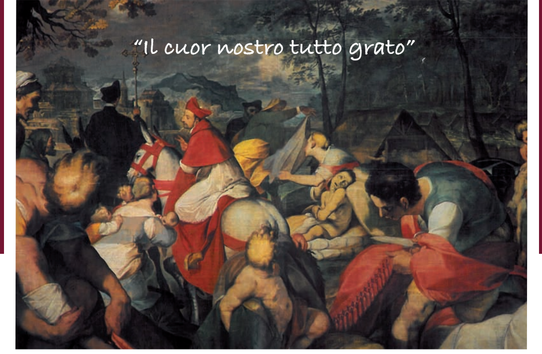
IV Centenario della canonizzazione 1610 - 2010