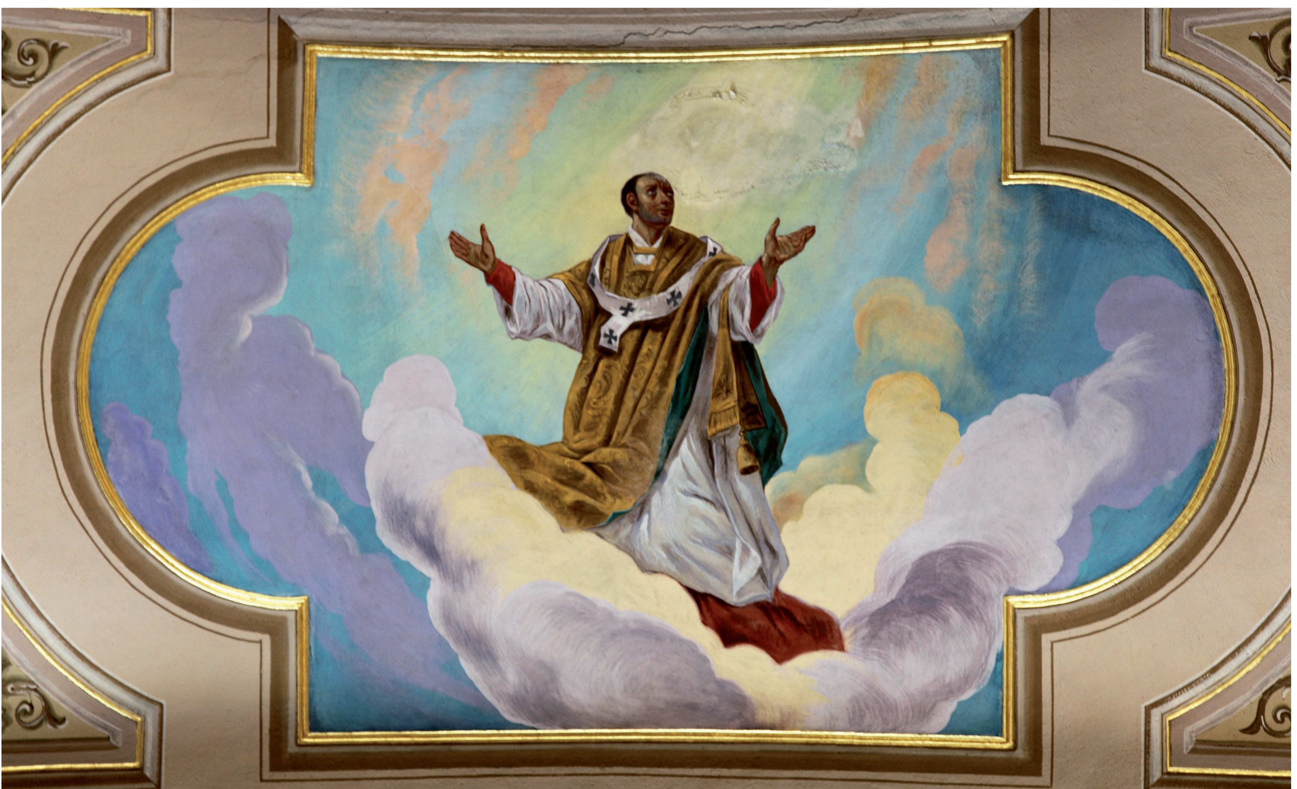
Affresco nella volta

Sotto l'indirizzo esterno della lettera rimangono le tracce del timbro in ceralacca. La lettera è indirizzata al milanese Alessandro Crivelli vescovo di Cariati, e porta la data di Roma 14 gennaio 1564. La lettera e l'indirizzo sono di mano di qualcuno dei segretari: la firma è autografa del Borromeo. La nota di registrazione della Nunziatura di Spagna è d'una terza mano".